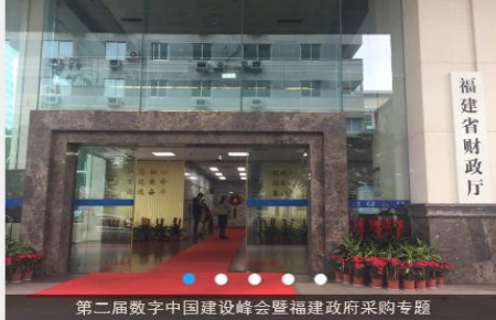
第二届数字中国建设峰会暨福建政府采购专题